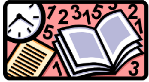
Figure 1. (a) Example picture for the first time; (b) the same picture side-by-side with the first one. Please use vector graphics where possible.